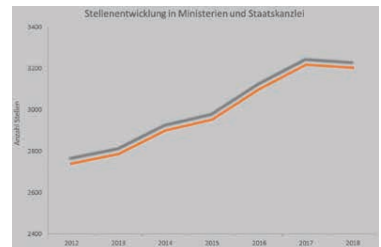
Die Regierung um Ministerpräsident Weil hat den Personalschlüssel in Staatskanzlei und Ministerien kräftig aufgestockt – vorrangig um ausreichend Versorgungsposten zu schaffen. Allein im Haushaltsjahr 2017 ist erneut ein Aufwuchs von rund 118 Vollzeitstellen im Vergleich zum Vorjahr geplant.

Auch das Lieblingsprojekt von Ministerpräsident Stephan Weil – die Einführung von vier neuen Ämtern für die regionale Landesverwaltung – beschränkt sich in seiner Wirkung darauf, den Ministerialapparat weiter aufzublähen. „Neue Posten schaffen SPD und Grüne im Handumdrehen. Die notwendigen Einsparungen werden hingegen auf die lange Bank geschoben“, kritisiert Hilbers.