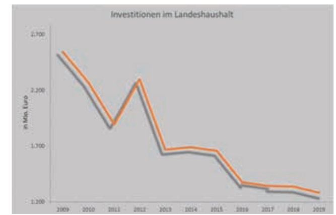
Die Investitionen des Landes sind unter Rot-Grün massiv eingebrochen. Und der Trend setzt sich fort: Trotz steigender Steuereinnahmen, plant die Regierung um Ministerpräsident Stephan Weil die Investitionen auch in den kommenden Haushaltsjahren weiter zurückzuführen.

Auch die Investitionsquote befindet sich unter Rot-Grün trotz der sehr guten Haushaltslage weiter im Sinkflug. Im Haushaltsplanentwurf 2017 liegt sie gerade noch bei 4,5 Prozent – ein historischer Tiefstand. Ein Aufwärtstrend ist nicht in Sicht: Laut Mittelfristiger Finanzplanung (Mipla) sollen die Investitionen bis 2020 sogar noch weiter gekürzt werden. Hilbers: „Die jüngsten Appelle des Landesrechnungshofes und der niedersächsischen Wirtschaft verhallen einmal mehr ungehört. Straßen und Häfen bleiben in diesem Doppelhaushalt unterfinanziert – der Breitbandausbau spielt für Rot-Grün offenbar überhaupt keine Rolle.“