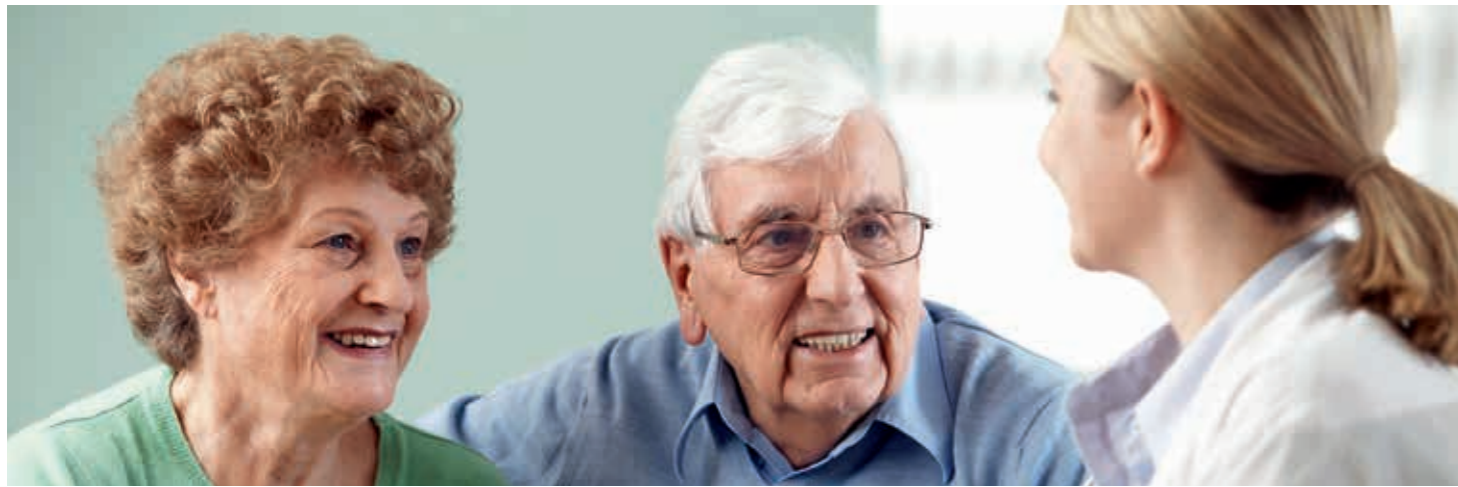
Vor allem ältere Menschen sind auf eine wohnortnahe hausärztliche Versorgung angewiesen.