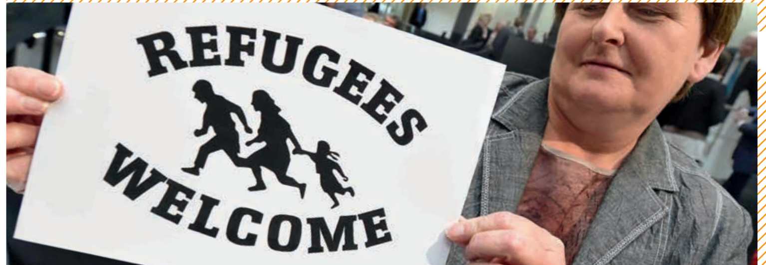
Refugees Welcome? Von wegen - noch im September 2015 bekundete SPD-Fraktionschefin Johanne Modder zu Beginn der Sondersitzung des Landtags zur Flüchtlingssituation ihre Solidarität - inzwischen ist es mit der Willkommenspolitik für Flüchtlinge bei der SPD offenbar vorbei.

Kürzlich beklagte Niedersachsens Ministerpräsident Stephan Weil im NDR, mit der unbefristeten Aufnahme von Flüchtlingen im Herbst 2015 sei ein falsches Signal in die Welt gesendet worden. Man habe damit Millionen Menschen Hoffnungen gemacht, die Deutschland nicht erfüllen könne. Ein unmissverständlicher Seitenhieb auf die Kanzlerin. Schon in einer Regierungserklärung im Mai hatte Weil der Bundesregierung vorgeworfen, sie habe maßgeblich dazu beigetragen, dass es in Deutschland so viele Flüchtlinge gebe.