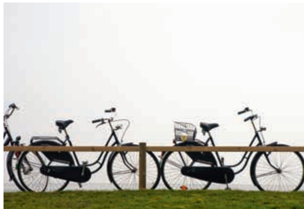
Die ostfriesische Nordseeinsel Juist ist bereits autofrei und möchte bis 2030 Deutschlands erste klimaneutrale Insel werden.

Vor diesem Hintergrund fordert die CDU die Landesregierung auf, ein „Modellprojekt emissionslose Nordseeinsel“ zu starten und dieses Projekt finanziell entsprechend auszustatten. Die Ergebnisse des Projekts sollen dann auf ihre Übertragbarkeit auf andere Regionen Niedersachsens untersucht werden.