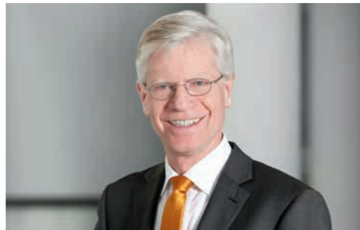
Burkhard Jasper, MdL – CDU-Landtagsabgeordneter.

Darüber hinaus müsse sich die Landesregierung auf Bundesebene, vor allem aber als Aufsichtsbehörde in Niedersachsen, dafür einsetzen, dass die Kassenärztliche Vereinigung notwendige Maßnahmen der Bedarfsplanung in unter- und übertensorgten Gebieten ergreift. Auch eine wirksame Niederlassungsförderung sei entscheidend: zum Beispiel durch Sicherstellungszuschläge, Investitionskostenzuschüsse, Umsatzgarantien für Niederlassungen und Stipendien für Studenten, die sich regional verpflichten. Die Delegation an Versorgungsassistenten unter Führung des Hausarztes muss ausgebaut werden. Dadurch wird der Hausarzt nicht nur in der Praxis, sondern vor allem bei zeitintensiven Hausbesuchen entlastet. Jasper: „Im Landkreis Osnabrück gibt es ein hervorragendes Modell, das durchaus nachahmenswert ist. Dort wurde auf Initiative des Hausärzterverbandes und des Landkreises für solch eine Ausbildung eine finanzielle Unterstützung in Höhe von 1.000 Euro ausgemittelt.“