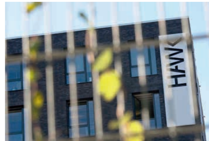
In einem Seminar an der Hildesheimer Hochschule für angewandte Wissenschaft und Kunst (HAWK) soll den Studierenden über Jahre hinweg ein zutiefst antiisraelisches, in Teilen sogar antisemitisches Weltbild vermittelt worden sein.

HAWK und Ministerium blieben im Hinblick auf umstrittenes Seminar zu lange tatenlos