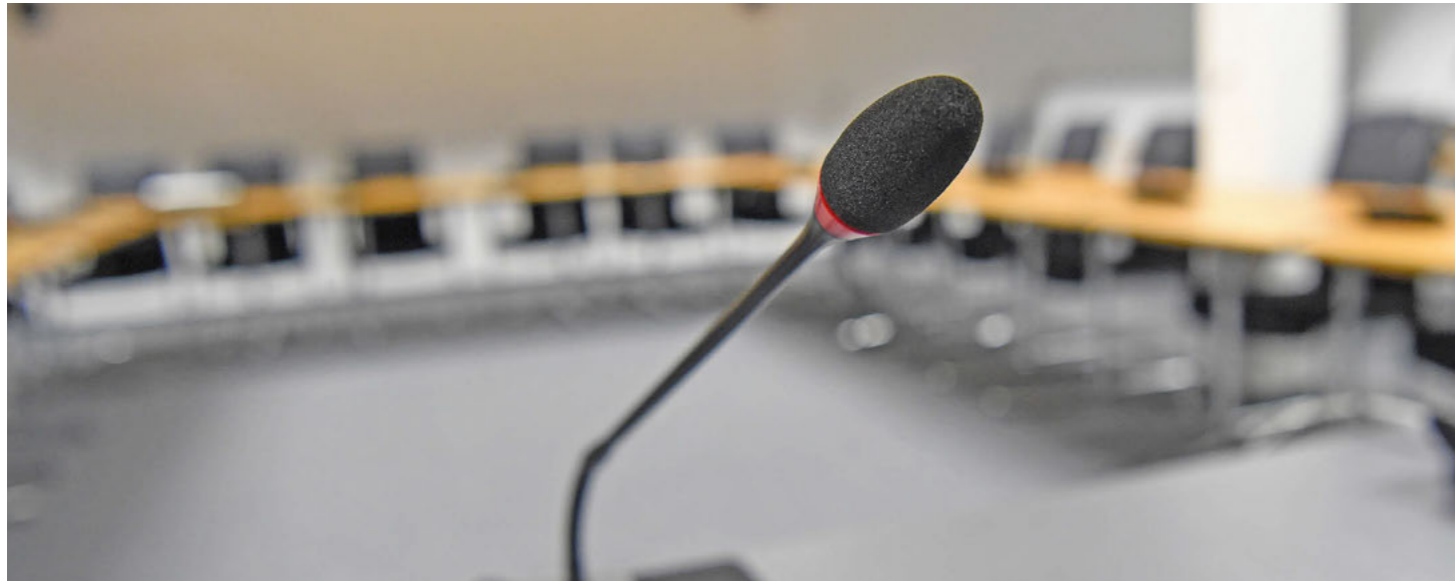
Aufgrund der sehr eng gefassten Aussagegenehmigung von Landesbeamten ist der Erkenntnisgewinn durch die Zeugenbefragungen im PUA oft verschwindend gering.

Landesregierung mauert bei Aufarbeitung von Fehlern und Versäumnissen in der Terrorabwehr