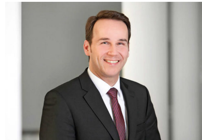
André Bock, MdL – Abgeordneter der CDU-Landtagsfraktion

Hannover. Zu wenig Personal, zu wenig Unterricht, zu wenig Handlungsspielraum – die CDU-Landtagsfraktion wirft der rot-grünen Landesregierung vor, die Weichen für die Berufsbildenden Schulen (BBSen) in Niedersachsen falsch gestellt zu haben. „Die Kultusministerin hat offensichtlich nicht verstanden, dass an den BBS vor allem ausreichend Unterricht stattfinden muss, um den Fachkräftenachwuchs in Niedersachsen vernünftig auszubilden“, sagt der CDU-Landtagsabgeordnete André Bock. Die Unterrichtsversorgung an den BBSen ist mit nur noch 88,6 Prozent auf einem historischen Tiefstand angekommen. Trotzdem plant das Kultusministerium weitere Stellenstreichungen. Bock: „Mit weniger Lehrern lässt sich nicht mehr Unterricht erteilen. Die Schulleiter müssen dringend wieder selbst über die Einstellung von Lehrpersonal an ihren Schulen entscheiden dürfen.“ Die Einstellungsverfahren sind 2014 von Rot-Grün im Kultusministerium zentralisiert worden. Einen Antrag der CDU-Fraktion zur Stärkung der beruflichen Bildung lehnten SPD und Grüne im Oktober-Plenum ab.