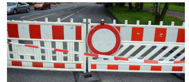
Vor allem dem kommunalen Straßenbau drohen unter Rot-Grün in den kommenden Jahren drastische Kürzungen.

Ähnliches gilt für die Krankenhausfinanzierung: Jüngste Anhörungen im Landtag haben deutlich gemacht, dass es einen großen Investitionsbedarf an niedersächsischen Krankenhäusern gibt. Hilbers: „Darauf hat die Landesregierung keine Antworten, geschweige denn Lösungen.“