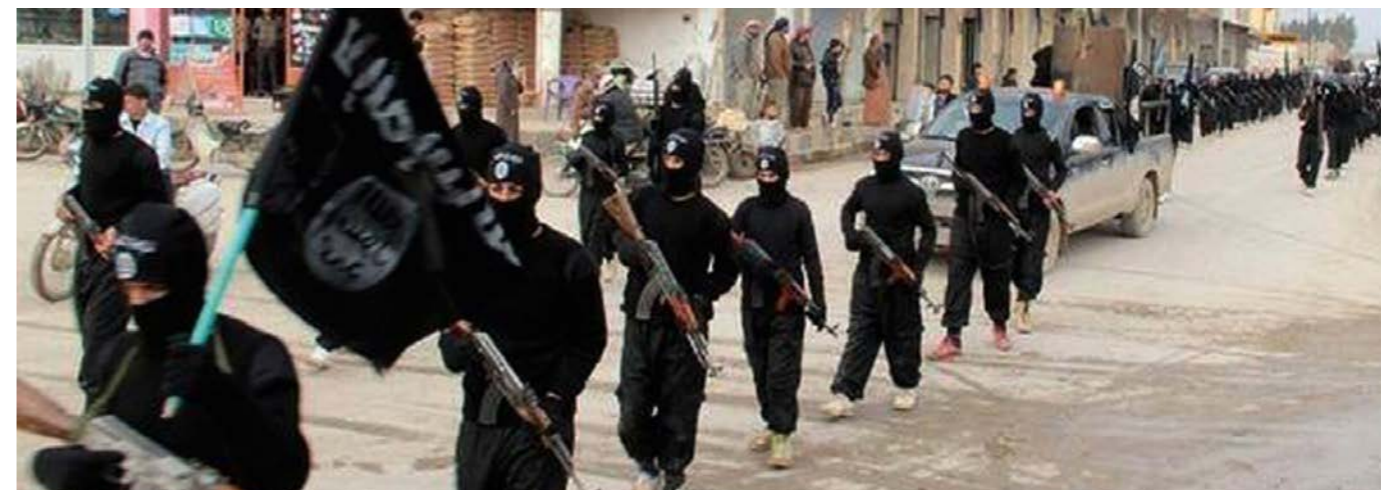
Vermummte Kämpfer des IS ziehen durch die Straßen von Raqqa (Syrien) – laut Schätzungen der Sicherheitsbehörden sind bislang rund 400 Islamisten von Deutschland aus nach Syrien und in den Irak gereist – mindestens 15 von ihnen stammen aus Niedersachsen.