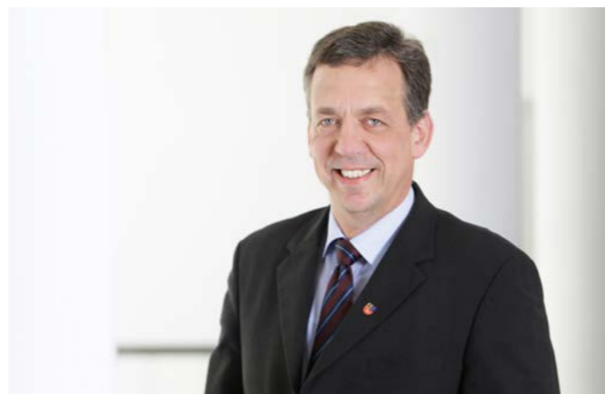
Helmut Dammann-Tamke, MdL – agrarpolitischer Sprecher der CDU-Landtagsfraktion

Diese Praxis will die CDU jetzt ändern – ein von der Fraktion vorgelegter Gesetzentwurf wurde im September-Plenum erstmals beraten. „Die bisherige Praxis wird vielfach als ungerecht empfunden. Die Folge ist eine verbreitete Ablehnung von Leitungsbauprojekten“, erklärt Dammann-Tamke. Heftige Kritik übt der CDU-Agrarexperte an der Untätigkeit der Landesregierung bei diesem Thema: „Rot-Grün hat sich zur Energiewende bekannt. Wie man mit Eigentumsverlusten oder -einschränkungen im Kontext des Netzausbaus umgehen soll, lässt die Re-