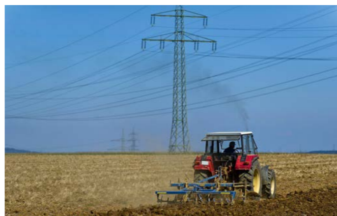
Der Gesetzentwurf der CDU-Fraktion fordert eine gerechte Entschädigung für Grundstückseigentümer, die vom Netzausbau betroffen sind.