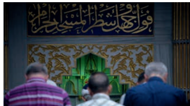
Die CDU-Landtagsfraktion will sich in dieser Legislaturperiode nicht mehr an den Verhandlungen über einen Vertrag mit den muslimischen Verbänden beteiligen.

Muslimen in den Mittelpunkt stellt – allerdings zu einem späteren Zeitpunkt.“ Ohnehin ist nur ein sehr kleiner Teil der in Niedersachsen lebenden Muslime überhaupt in Verbänden organisiert. In den Mitgliederverzeichnissen von DITIB und Schura stehen aktuellen Gutachten zufolge 12.900 für Niedersachsen eingetragene Mitglieder. Schätzungen zufolge leben aber deutlich mehr als 250.000 Muslime in Niedersachsen. Im Hinblick auf die Alevitische Gemeinde Deutschland spricht sich Thümler für eine Fortsetzung der Vertragsverhandlungen aus. „Die Gespräche mit der Alevitischen Gemeinde als eigenständiger Religionsgemeinschaft werden schon lange getrennt von den Verhandlungen mit DITIB und Schura geführt. Es gibt weder gravierende strittige inhaltliche Fragen, noch werden die Verhandlungen durch aktuelle Entwicklungen überlagert. Es spricht nichts dagegen, hier bald zu einer Einigung zu kommen, die bereits seit längerer Zeit greifbar ist“, so Thümler.