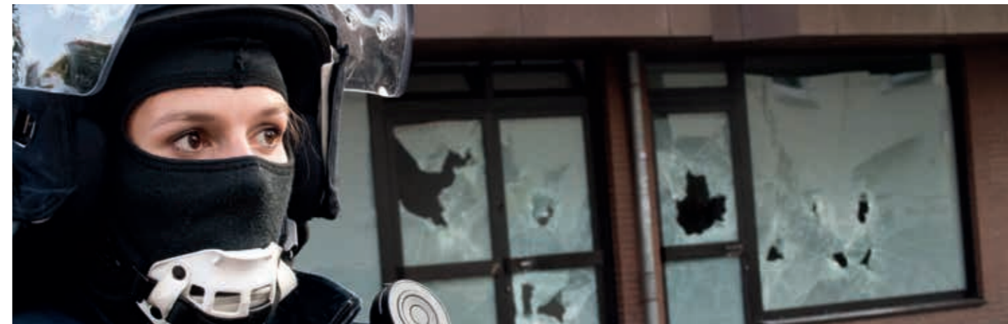
Für die Abwehr islamistischer Gefahren, wie hier bei einer Razzia in Hildesheim, braucht die Polizei solide rechtliche Befugnisse. Diese würde das rot-grüne Polizeigesetz massiv beeinträchtigen.

Die Sicherheitslage in Niedersachsen hat sich verschärft. Rot-Grün will Befugnisse der Polizei dennoch massiv einschränken.